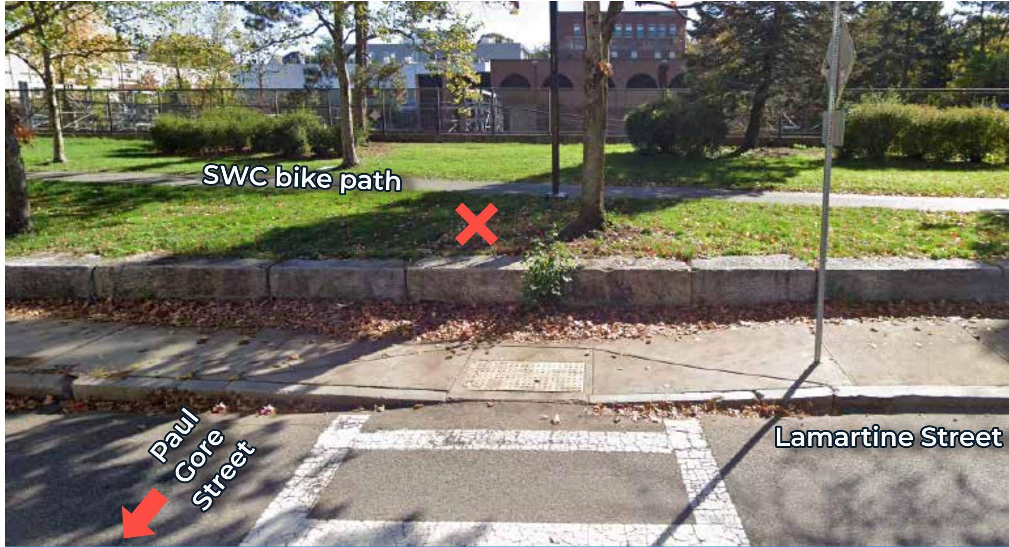
No hay rampa a la ciclovía Southwest Corridor de Paul Gore Street.

La gente ya va en bicicleta en ambos sentidos de Boylston Street. 1 de cada 5 ciclistas circula a contraflujo cerca de Danforth Street, la cuadra cercana al Southwest Corridor.