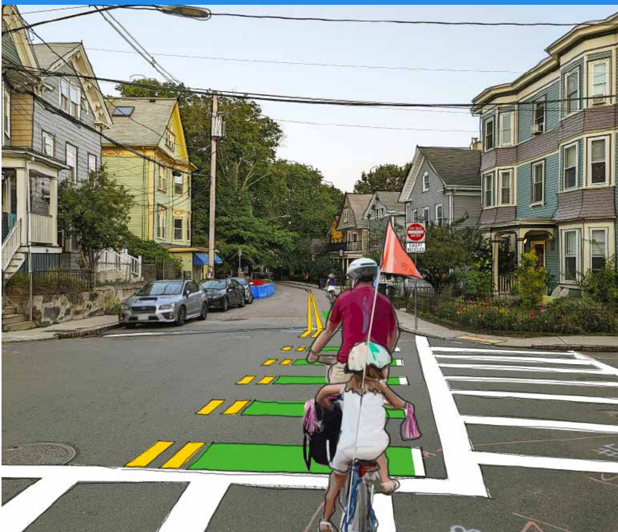
Una ilustración de Boylston Street con una ciclovía a contraflujo.

El volumen de vehículos es moderado. Podemos hacer la calle más segura y cómoda con badenes.